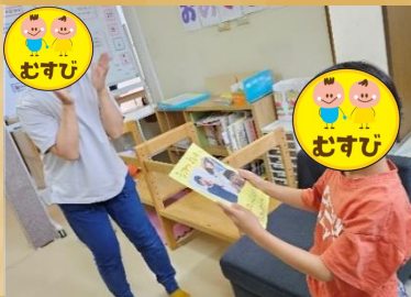
毎月恒例のお誕生会。誕生日の子は皆の前へ。お友達から一言ずつ「お誕生日おめでとう」とメッセージを贈り、元気なパステルソングを歌ってお祝いしました。最後に全員で書いたメッセージカードをプレゼントしました。