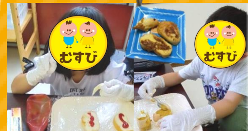
フレンチトースト チーズパン