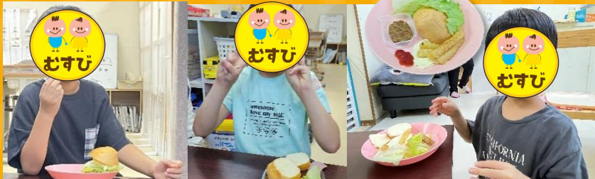
この日は9月17日「中秋の名月」。皆で「オリジナル月見バーガー」を作りました。2～4年生が準備を担当。ロールパンを半分に切ってパンズに。ミニハンバーグ・チーズ・ハム・レタス・うすらの卵の目玉焼きを並べて自由に選んでもらいました。